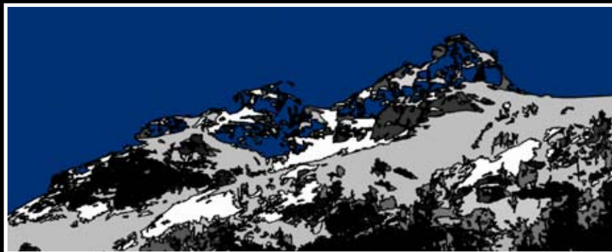
Utsnitt fra Frøydis H. Knutsens "Fjell" - 100x110 cm, akryl på lerret