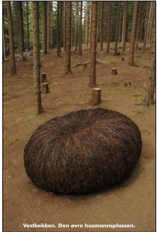
Vestbekken. Den øvre husmannsplassen.

på kroken, og der blir potensielt besøkstall en viktig faktor. For min egen del når det gjelder Daisy '05 må jeg si at jeg hade overveldende stort besøksantall i Gulden Skog i og med den kulturelle skolesekken, men det blir vel et litt annet regnestykke.