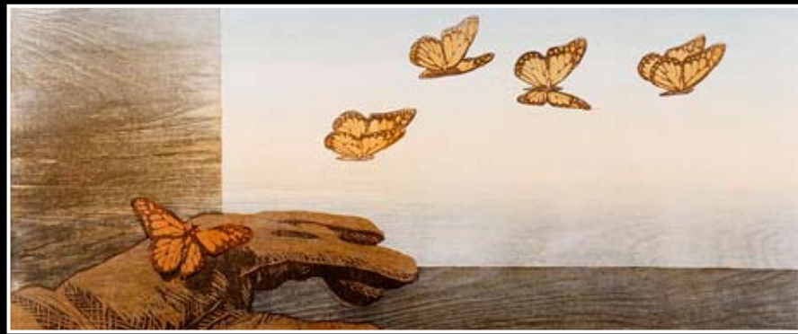
Motiv: Utsnitt av "Den gode skal vinne" av billedkunstner Einar Sigstad