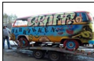
Bilen ble gitt av Fabrikken ble utsmykket av ungdommene i samarbeid med billedkunstner og kurs-leder Jeton Troni.