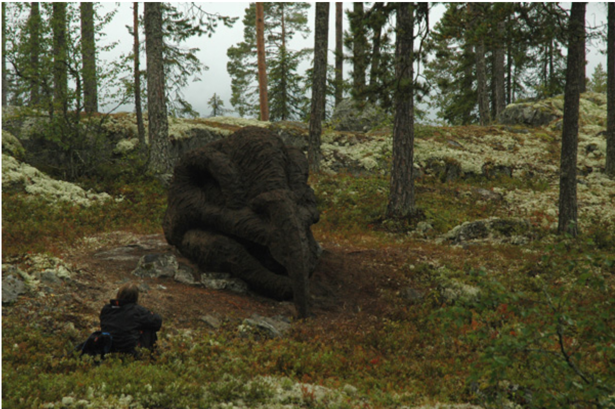
Anna Widén: Trofé II, Kvitmannsberget, Lillehammer 2008. (Foto: A. Widén)

Selv om den generelle visjonen om MYCELIUM er enkel og klar, mener jeg at det eneste forsvarlige er å betrakte og behandle etableringen eller oppstarten av organet MYCELIUM som et eksperiment. Konsekvensen av et slikt syn er at etableringen ikke må ha for stive rammebetingelser, men være åpen for endringer i arbeidsformer og organisering under veis.