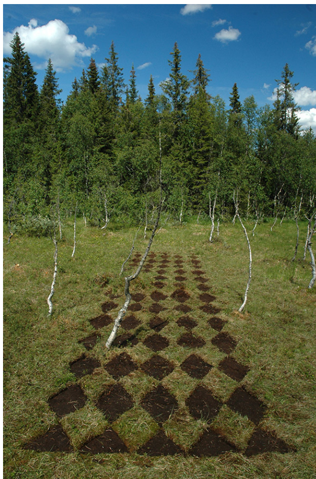
Anna Widén/Ulrika Orvedal: "Myr" Aasethsbogen, Biristrand 2006. (Foto: A. Widén)