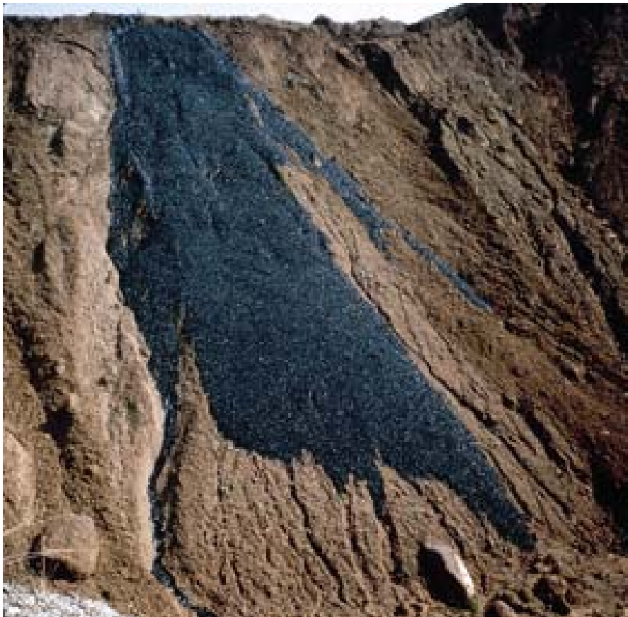
Robert Smithson: Asphalt Rundown. Utenfor Roma 1969.

d) November – Desember 2009: MYCELIUM etableres fra 1/1-2010. MYCELIUMs råd etableres fra samme tid.