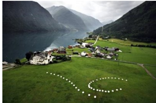
Magne Vangsnes: ONN. Fjærland 2006.