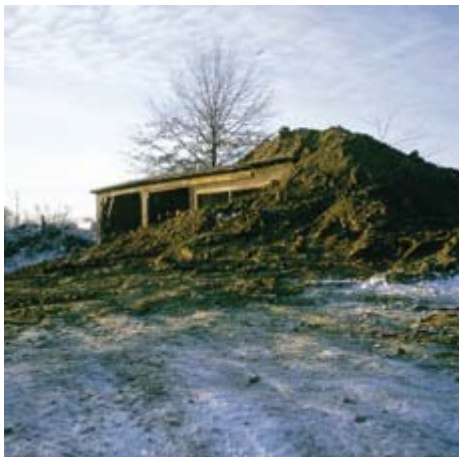
Robert Smithson: Partially buried woodshed. Kent, Ohio 1969.

Når betegnelsen "stedskunst" erstattes av betegnelsen "desentralisert kunstpraksis" for Myceliumprosjektet blir feltet bestemt som et handlingsfelt, ikke som en kunstform eller en kunstgenre i en formal betydning. Betegnelsen "desentralisert" dekker de fenomenene vi mener å dekke – kort: "arbeider som ikke er innstengt av gallerier eller parker"- og ved å bruke betegnelsen på denne måten knytter vi an til Smithsons ordbruk, dvs. til en tradisjon.