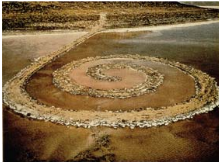
Robert Smithson: Spiral Jetty. Salt Lake, Utah. 1970.

Forslaget om MYCELIUM kommer nå fordi det er en del av denne større prosessen. Den kunstpraksis MYCELIUM springer ut av og ønsker å arbeide videre ble på 1960-tallet betegnet som Land-Art eller Earth-Art. Den er ikke sentral for noen av de andre initiativene som er nevnt ovenfor.